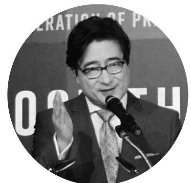
司会のジョン・カビラ氏