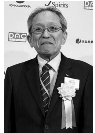
「中小企業庁 長官賞」を受賞した大塚理事