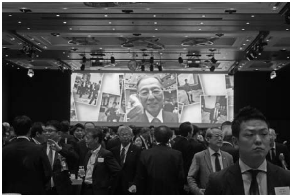
記念パーティーの様子