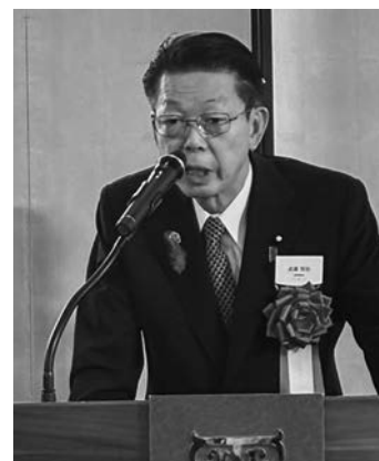
武藤前経済産業大臣