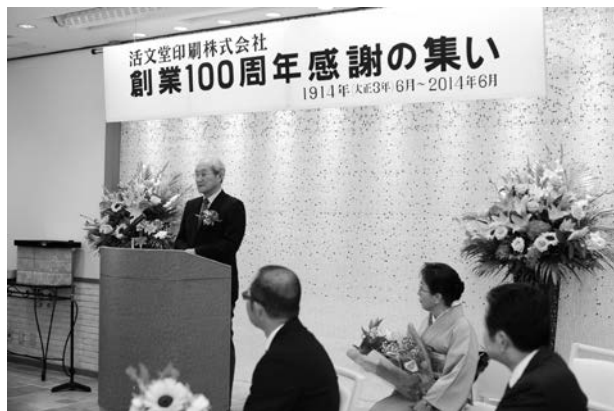
創業 100 周年感謝の集いの様子

続いて、昭和 20 年 6 月 29 日の岡山大空襲では、過去の歴史に関わる資料のほとんどが失われました。唯一手元に残ったのは、倉敷翠松高校の前身「翠松舎」の交友誌です。創刊号は昭和 2 年で、三村活文堂で作らせていただき大変貴重なものです。【写真あり】