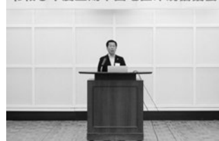
令和5年度上期中国地区印刷協議会

午後4時20分から再び全体会議が行われ、4分科会の報告と情報交換が行われた後、午後6時から懇親会が開宴となりました。岡山県工組からは、大塚理事長以下副理事長、専務理事の6名が参加しました。