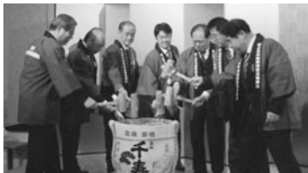
鏡 開 き