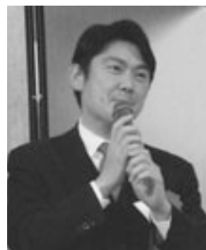
山下たかし 衆議院議員