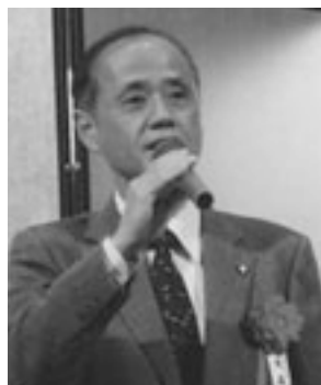
大森雅夫 岡山市長