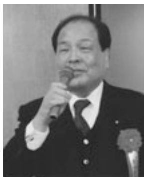
片山虎之助 参議院議員